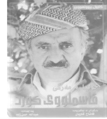
خولیاو مەرگی قاسملووی کورد